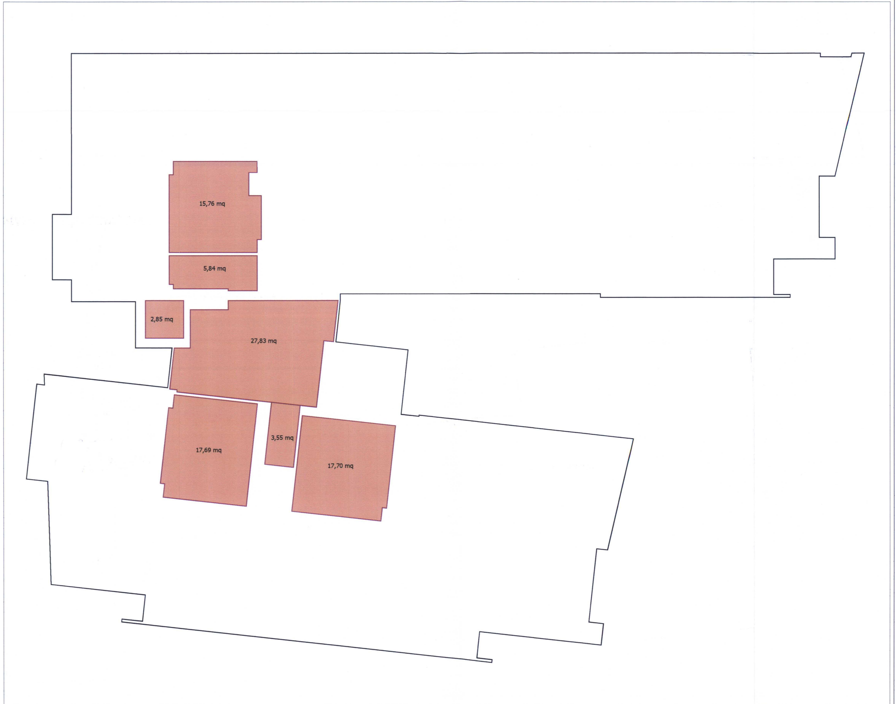
DETERMINAZIONE DELLE SUPERFICI PER LA VERIFICA DELLA CONGRUITA' DEI COSTI - PIANTE PIANO COPERTURE - SCALA 1:100